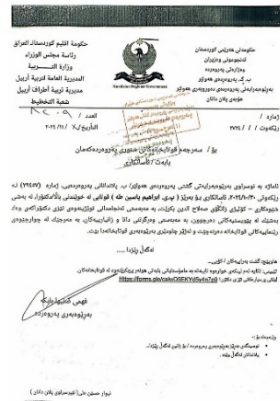
Created with Scanner Pro