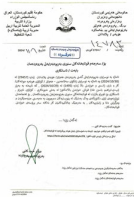
Created with Scanner Pro