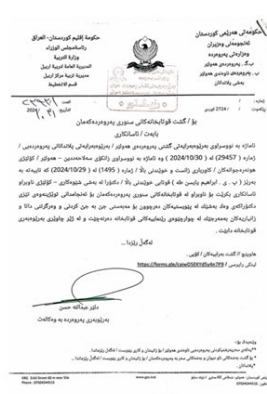
Created with Scanner Pro