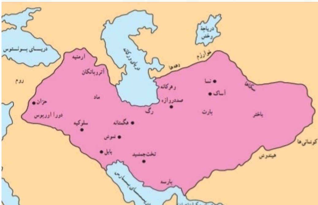
(قادری، 1390: 169) پاشکۆ، 1 سنووری جوگرافی دهوله تی نهشکانی