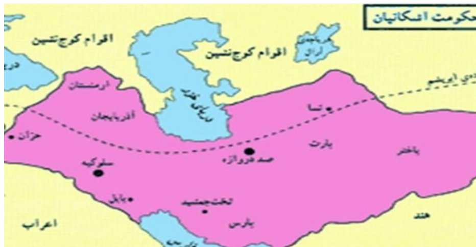
(قادری، 1390: 168) پاشکۆ، 2 پنگای ناوریشم