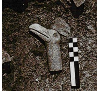
شیوهی ژماره (۱)