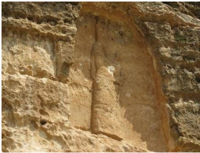
شیوهی ژماره (۹-ب)

به دیار که وتون (باقر، سه رچاوهی پیشوو، ۷۲۴-۷۲۸). ئیستا به هه ولی شوینه وارناسانی بیانی بۆته پارکی شوینه واری (سه نحاریب) و خه لک له ناو خو و دهره وه سه ردانی ده کهن. هه ر وهک په یکه ری هه لکۆلراوی پاشاییه کی ئاشووری داتاشراو له قه دپالی شاخ، که بۆ سه رد می پاشا (سه نحاریب) ده گه رپته وه. بروانه شیوهی ژماره (۹-۱) و (۹-ب). به گشتی خاسیه ته کانی هونه ری په یکه رتاشی ئاشووری (۲۰۰-۶۱۲) پیش زاین، له شارستانییه تی (میزوپۆتامیا) زیاتر گه شان هوهی به خو یه وه بینوو، به به رانبه ر به شارستانییه ته کانی پیش خو، به تاییه تی بوونی رپژه یه کی زۆری به ره می په یکه رتاشی دیوار به ندی و باز نه یی له که ره سته ی به رد، ئه وهش به هوی سروشتی ناوچه ی شاخاوی ژیر فه رمان په وایی ولاتی ئاشوورییه کان ده گه رپته وه.. (پیریال، سه رچاوهی پیشوو، ۲۴).