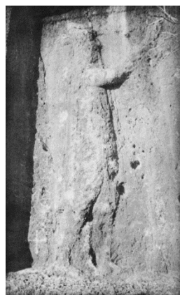
شیوهی ژماره (۲)

کرداری گوزارشتکردن له ریگه‌ی یه‌ک یاخود کومه‌لیک هیما و ئاماژه‌ی له‌سه‌ر به‌ره‌می هونه‌ری هه‌لکولراو ده‌ناسریته‌وه. خاکی کوردستانیش سه‌روه‌تیک‌ی ده‌وله‌مندی شارستانیه‌تییه‌کانی له هونه‌ر و شوینه‌وار بۆ ماوه‌ته‌وه.