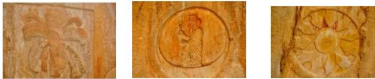
بره وانه شیوهی (۷-ج)

له رووی ره هندی گوزارشت ئه م هه لکولراوه ش وهک گشت داتاشراوه کانی سنووری خاکی کوردستان به هۆکاری سروشتی و مرویی که میک شیونراوه، به لام ده توانین به شیک له ورده کارییه کانی ناوه رۆکی ئه م داتاشراوه بینین. هر وهک بوونی هیما سی خواوند له به شی سهره وهی کاره که هه لکولراون، که هیما سی خواوندی عه شتار بره وانه شیوهی (۷-أ) و خواوندی مانگ بره وانه شیوهی (۷-ب) و ئاهورامه زدا بره وانه شیوهی (۷-ج) به شیوه یه کی ئه ندازه یی و نه خشینراون.