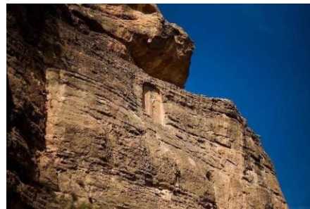
شیوهی ژماره (۹-۱)