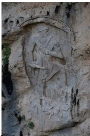
شیوه ی ژماره (V)

پیکهاته ی دارشتنی ئه م په یکه ره داتاشراوه له چه ند که سایه تیه کی جیاواز له پله و پۆستا جیاوازن، هه روه ک له پروی قه باره و شوناس و ئاماژه ی هونهری شدا جیاوازن. له م به رجه سه ته داتاشراوه دا که سایه تی پاله وان و قاره مانیکی قه باره مه زن و چه ندین که سایه تی بچووک و لاواز له ژیر پیکانی که و تون. ئاماژه ی هونهری له که سایه تیه کی بالاده ست و فرمانراوا و پاشا ده چیت، له دۆخی مه دیدانی جه نگا به سه ر جه سه ته ی دووژمه کانی تیپه رده بیت، که ئه مه ش ئاماژه یه به سه رکه و تنی جه نگیکی مه زن به سه ر هیزی نه یاردا و وه ک له شوینه واری تهر م و لاشه ی ژیر پیکاندا به جیماوه، هه روه ها دارشتنی په یکه ریکی به رجه سه ته له و به رزییه و به م هه مو و رده کاری و ته کنیک و گوزارشته بۆتا نمونه یه کی به رزی په یکه رتاشی کۆن له کوردستاندا.