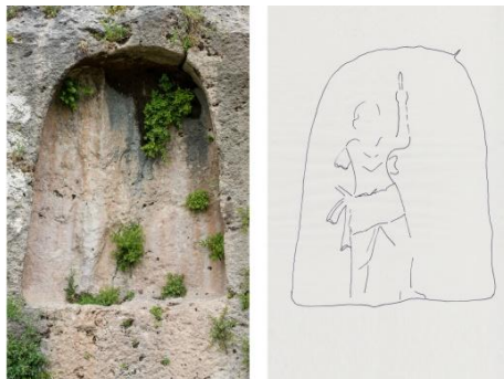
شیوهی ژماره (۸)

سەرچاوهیهکی باش بوونه بۆ بهرەو پیشبردنی ژیان و پیشاندانی داهینانهکان، که بۆته هۆی ئەرشیفکردنی هونەرکهکیان له چوارچیوهی شیوه و فۆرمیکی ساده.