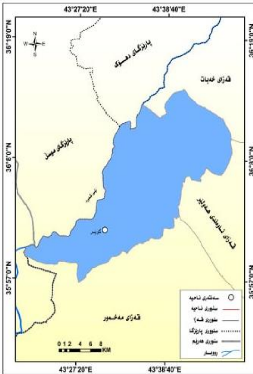
نەخشەى 2 _ ناحیهى كۆير به كۆيرهى يه كه كارگيره كانى ده و روبه رى