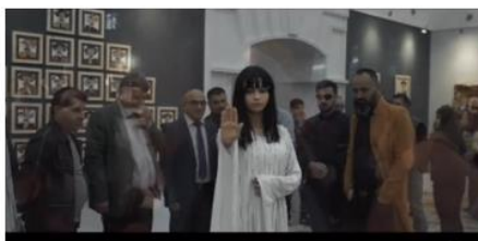
(شېوھە 7) ئازادى- ژن - ژيان، (2023)