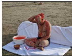
(شېوھە 4) - (قوربانى- 2022)