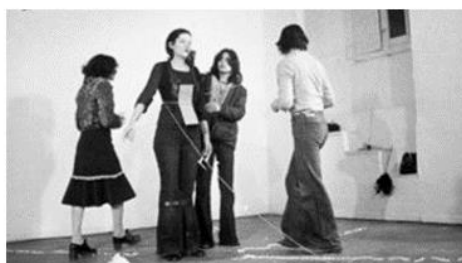
ريتم (Rhythm) (1974) (شيوه 1) روي له دا يك بووني دي مي مور 1992 (شيوه 2)

له لايه كي تر هونه ري جه سته زور شيوازي نمايشي هه يه بو نمونه له ريگه ي تو مار كردي في دي يو له داويدا نمايشكردي له هو له كان كه ده كريت هه مان في دي ويه كه له سه ر يه ك چه ندين جار لي بدر يته وه، يان وه رگرتي فو تو گراف له چه ند سو چي كه وه له داويدا نمايشكردي به چه ندين شيواز، هه نديك جار نه كت هريك نمايشي ك له جياتي هونه رمه ند ده كات ههروهك پيرفورمانسيكي جه سته. ريگه يه كي تري نمايشكردي نه ميش راسته وخوي له لايه ن خودي هونه رمه ند وه كو نمونه كي نه زمووني ك له لايه ن هونه رمه ندي ئوسترالي (ستيلارك - Stelarc) و" نا قيركروه يه كه له سه ربه نامي وه رگرتي جه سته و نمايشه تايه ته كان ي زور جار روي بو ت يان ته كنه لو جيا ني كه ل به جه سته ده كات، وه ك في دي وي (پرو دا ويكي نه لي كتروني نازاري- 1997) تا پا ده يه ك له گه ل جه سته يدا يه كخرا وه له (26) نمايشي جياوازا خو ي را كرتو وه"، (Art and design, 2020) ريگه ي به جه سته ي دا كه له دووره كو نترولي ماسولكه كان ي بكر ي ت كه له لايه ن هانده ره نه لي كتروني يه كان ي كه به ستر او نه وه (شيوه 3) ، له م نه زموونه جه سته پيروز نه ما، به لكو كرا به نامراز و گو را بو فيكر بو زماني ده رپرين، تيه ران دن، هانده ره نه لي كتروني هه كان رولي وه رگريان وه رگرت له ته واو كردي پيرفورمانسه كه.