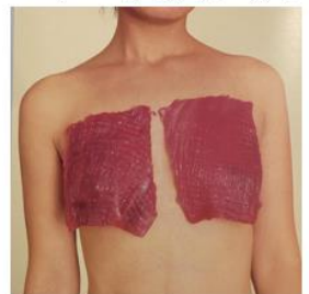
(شېوھە 6) - بېنارونېشان- 2020

ئەگەرە ناراستەخۆكانەوھ لە پېكھاتەى دەقەكەدا جېنگېر دەكات، ئەمەى (ھازە خاليد)، (شېوھە 6) (بېنارونېشان- 2020)، جەستەى رووت لە تايەتمەندىيەكانى جەسارەتە و لە رېگەى فۆتو بۆ وەرگەر نامىشى كر دووھ و تېگەيشتن و خەيالى وەرگرى كورد بەرەو تەواوكردى ماناكانە لە رېگەى لېكدانەوھى جياواز بەشداردەكات. لە دەھۆك (پەرى ئازاد) پېرپۆرمانسېك بە جەستەى خۆى نامىش دەكات، بە ناوونېشانى (ئازادى- ژن - ژيان)، (2023)، (شېوھە 7) ئەم جۆرە پېرپۆرمانسانەى ھونەرى جەستە لە دەھۆك كەمە و بەتايەتەى لە لايەن ئافرەت، بۆھە خويئندەوھى وەرگەر مەرجه پاشخانېكى كۆكراوھى زانبارى ھەبېت، بۆ ئەوھى وەرگەر بتوانن ئەم